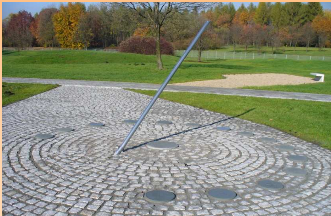
OGRÓD DOŚWIADCZEŃ W KRAKOWIE