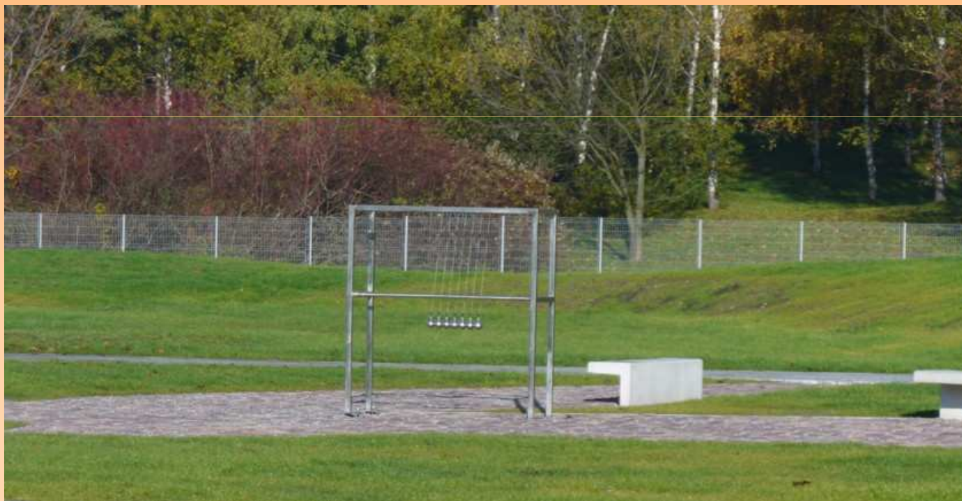
OGRÓD DOŚWIADCZEŃ W KRAKOWIE

Bezdyskusyjne jest posiadanie własnego, sprawnego zespołu opracowującego koncepcje nowych urządzeń i nadzorującego ich wykonanie lub zakup