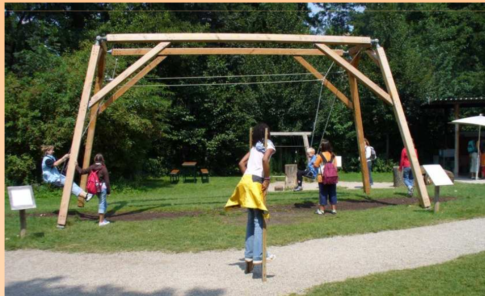
OGRÓD DOŚWIADCZEŃ W KRAKOWIE

Graubner – Play Stations for Developing the Senses according to Hugo Kükelhaus Richter Spielgeräte GmbH