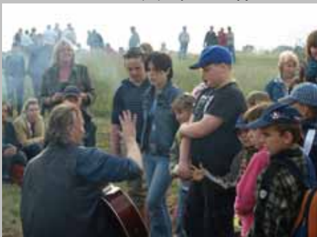
Stowarzyszenie Rozwoju Aktywności Dzieci SZANSA. (06.2008) Impreza wyjazdowa na Żmijowiskach we współpracy z Fundacją NA DOBRE.