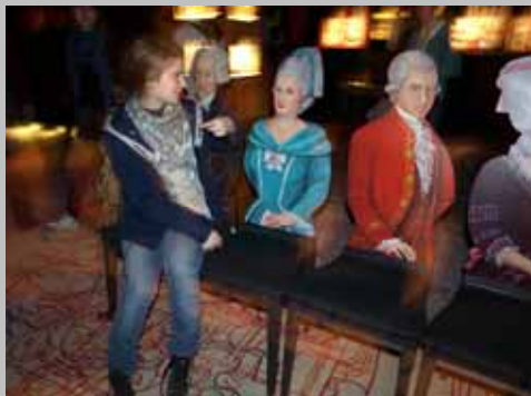
Zespół ŻAK, wizyta w „Haus der Musik” w Wiedniu.