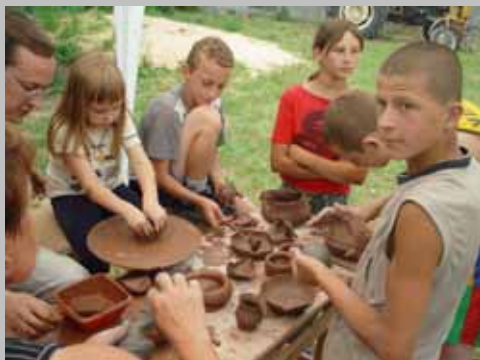
2005 DOBRE SOBIE – wiejskie letnie plenery artystyczne (edycja I)