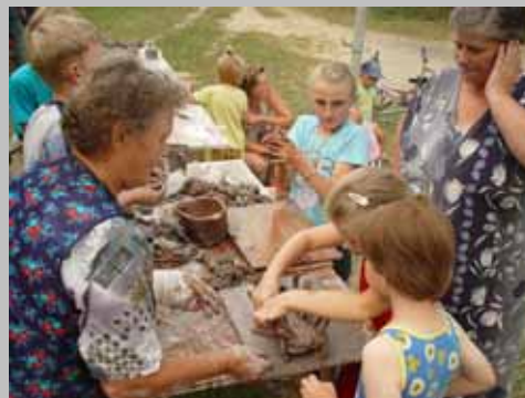
2005 DOBRE SOBIE – wiejskie letnie plenery artystyczne (edycja I)