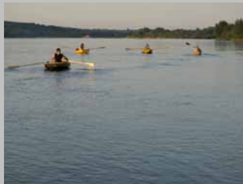
Warsztaty skutnicze zakończone spływem do Kazimierza.