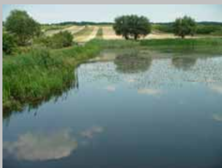
Łagodny stok południowego odcinka Skarpy w Dobrem i stawy rybne.