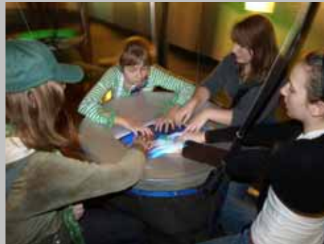
Interaktywne instalacje w „Haus der Musik” w Wiedniu.