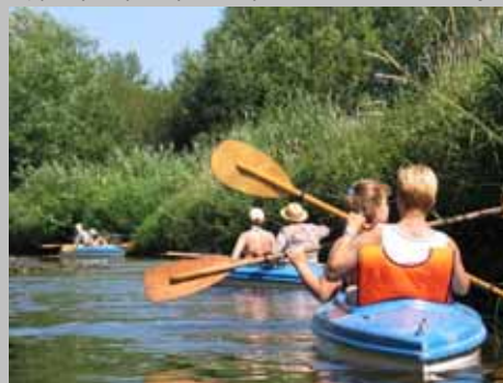
Nowe formy turystyki w regionie. Organizacja pętli szlaku Greenways. Splyw kajakowy rzeką Chodelką w kierunku Kazimierza Dolnego.