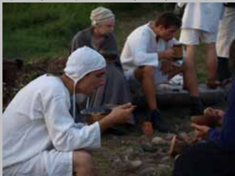
Rekonstrukcja życia codziennego średniowiecznych podróżnych. Kompania Św. Doroty na Żmijowiskach (2009)