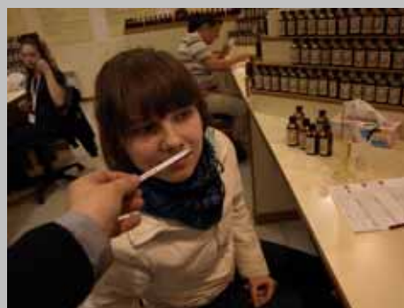
Podróże Zespołu Tańca i Muzyki Dawnej ŻAK – Harmonia zapachów, lekcja kompozycji perfum.