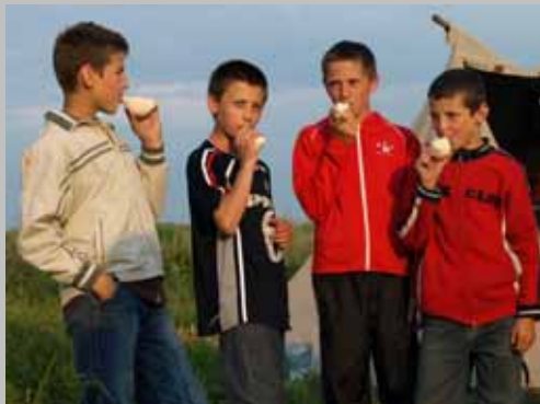
DOBRE instrumenty ceramiczne. Muzyka Ziemi na Żmijowiskach (2008)