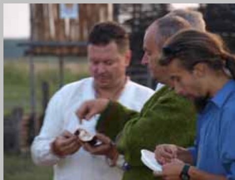
Rekonstrukcje przygotowywania historycznych kulinariów.