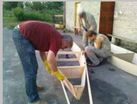
Nowe formy turystyki w regionie. Organizacja pętli szlaku Greenways. Warsztaty szkutnicze zakończone splywem do Kazimierza.