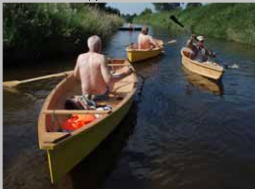
Warsztaty skutnicze „Budujemy Dobre Łodzie” i spływ do Kazimierza.