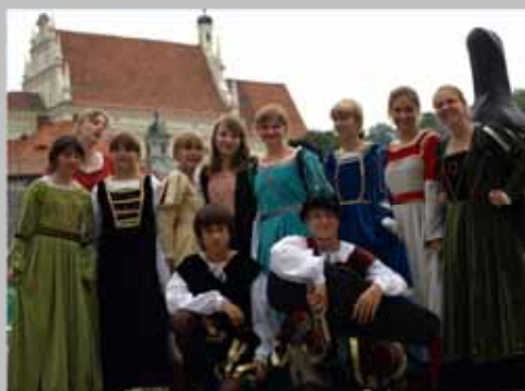
Zespół Tańca i Muzyki Dawnej ŻAK w Kazimierzu Dolnym.