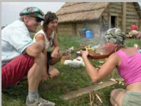
Rekonstrukcje archeologiczne, instruktaż rozniecanie ognia.