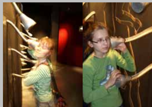
Zespół ŻAK, wizyta w „Haus der Musik” w Wiedniu.