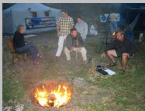
Warsztaty Archeologii Doświadczalnej (Żmijowiska 2008, 2009).