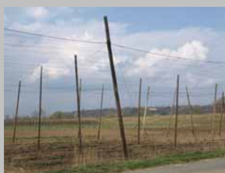
Na horyzoncie charakterystyczna sylwetka wysokiej, wapiennolessowej Skarpy Dobrskiej, w krajobrazie Gminy Wilków.