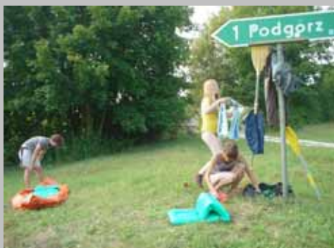
2008 Splyw Chodelką ze Żmijowisk do Kazimierza.