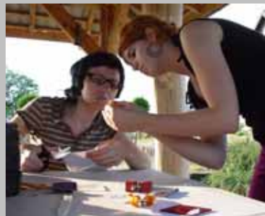
2007 - 2008 DOBRE WESELEJ Warsztaty witrażu, akcje we wsi z okazji jubileuszu St. Wyspiańskiego