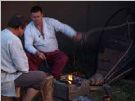
Warsztaty Archeologii Doświadczalnej (Żmijowiska 2008, 2009).