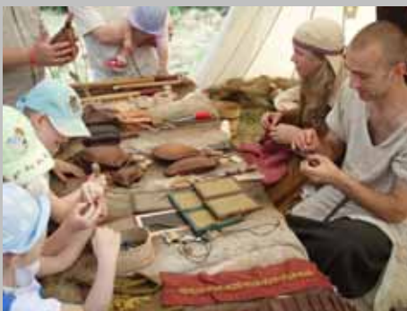
Historia terenów Gminy Wilków. Warsztaty rzemiosł historycznych Współpraca Fundacji NA DOBRE z archeologami.