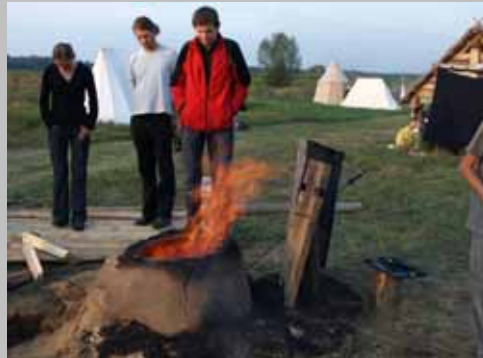
Wypal ceramiczny w odtworzonym piecu opalonym drewnem.