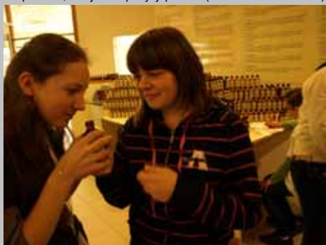
Zespół Tańca i Muzyki Dawnej ŻAK we Francji - Harmonia zapachów, lekcja kompozycji perfum (Parfumerie Gallimard).