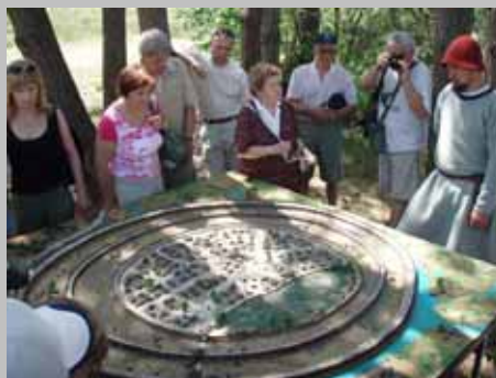
Historia osadnictwa na terenach Gminy Wilków.