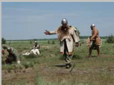
Historia terenów Gminy Wilków. Ścieżki edukacyjne i imprezy w rejonie grodzisk średniowiecznych nad Chodelką.