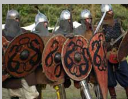
Historia terenów Gminy Wilków. Rekonstrukcje archeologiczne przeszłości w rejonie grodzisk średniowiecznych nad Chodelką.