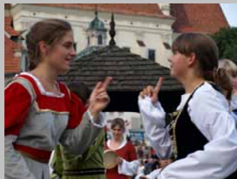
Zespół Tańca i Muzyki Dawnej ŻAK w Kazimierzu Dolnym.