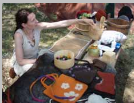
Historia terenów Gminy Wilków. Warsztaty rzemiosł historycznych.